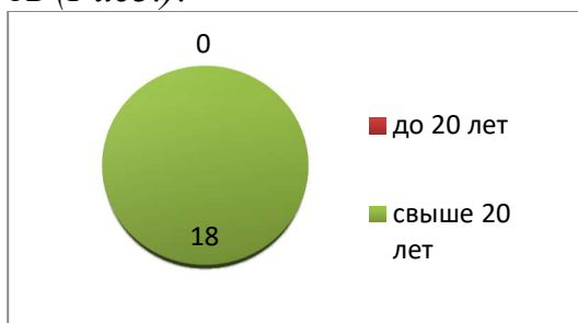
Рисунок 3. Анализ состава педагогов по стажу

Анализ кадрового состава по педагогическому стажу подтверждает стабильность педагогического коллектива, наблюдается положительная динамика в сторону увеличения числа педагогов со стажем работы в ДОО. В детском саду имеется «Положение о системе наставничества педагогических работников в МБДОО «Детский сад присмотра и оздоровления № 46 «Светлячок» (утверждено приказом заведующего ДОО № 77 от 31.03.2023г). В 2025 году молодых педагогов в учреждении нет, наставнических пар - нет.